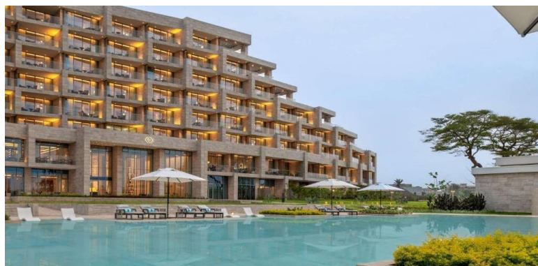
Sofitel Cotonou Marina Hotel & Spa *****