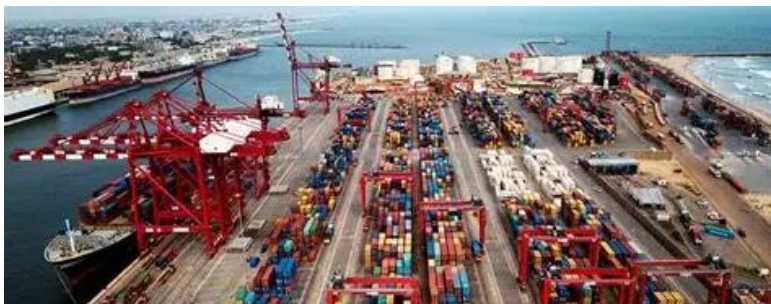
Port de Cotonou