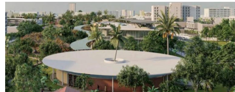
Maquette du QCC de Cotonou