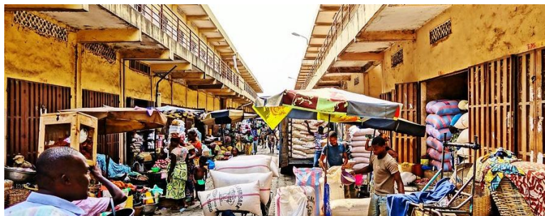
Marché international (Dantokpa)