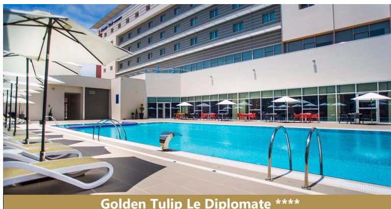
Golden Tulip Le Diplomate ****